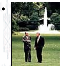
Jacques Chirac con Bill Clinton (junio del 1996)