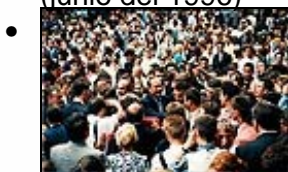
Recepción del 14 julio del 1996