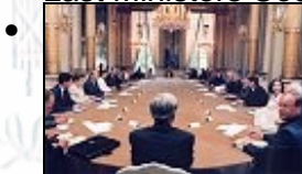
First Ministers Council of L. Jospin's first government