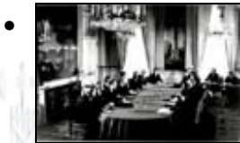
Last Ministers Council Meeting with G. Pompidou