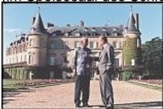
Besuch von Nelson Mandela, dem Präsidenten der Republik Südafrika am 13. Juli 1996 (Schlosspark)