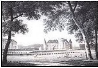
Ansicht und alter