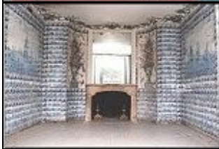
Das Badezimmer des