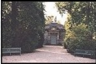
Die Molkerei der Königin