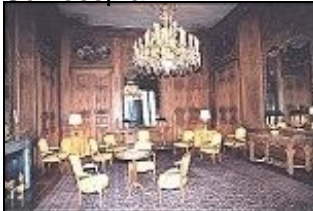
Der Grand Salon