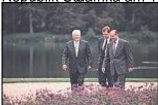
Besuch von Frau und Herrn Boris Yeltsin am 20. Oktober 1995 (Schlosspark)