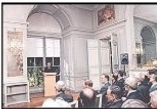
Eröffnung der Kosovo-Friedenskonferenz am 6. Februar 1999 (im Speisesaal des Schlosses)