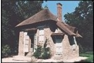
Der Strohschuppen (La Chaumière aux coquillages)